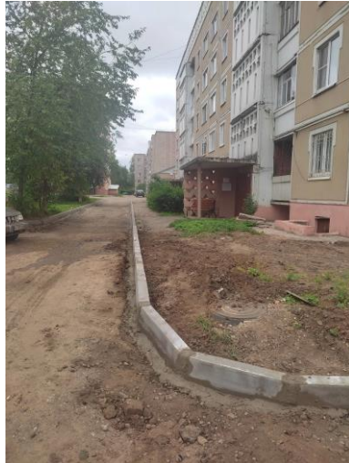
г.п.г. Нерехта, ул. Дружбы, д. 11