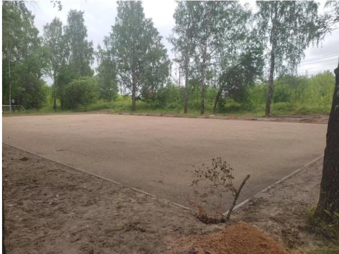
Фото выполнения работ по благоустройству мест массового отдыха населения (городских парков) по состоянию на 28.06.2023