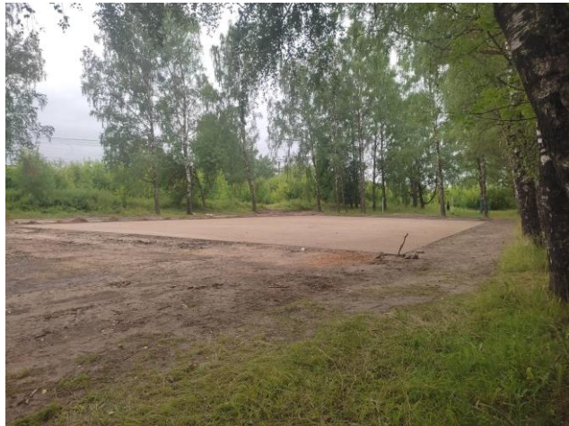
Стадион «Дружба» (вариант 2)