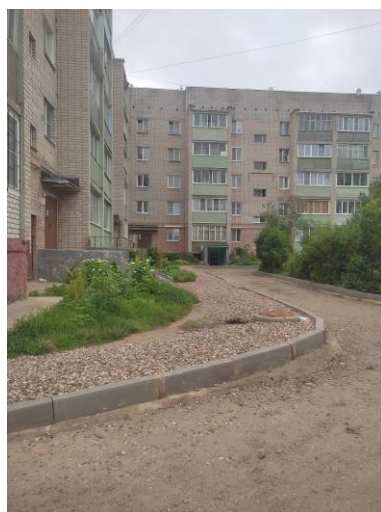
г.п.г. Нерехта, ул. Дружбы, д. 11

г.п.г. Нерехта, ул. Дружбы, д. 13 26.12.2022 заключен муниципальный контракт № 01413000266220000520001 с ИП Атоян Людвик Леонович (г. Кострома).