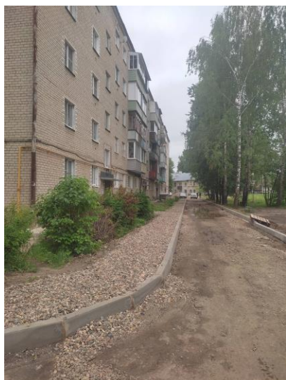
Фото выполнения работ по благоустройству придомовых территорий по состоянию на 28.06.2023

бюджет муниципального района город Нерехта и Нерехтский район — 3 065 800,00 руб.